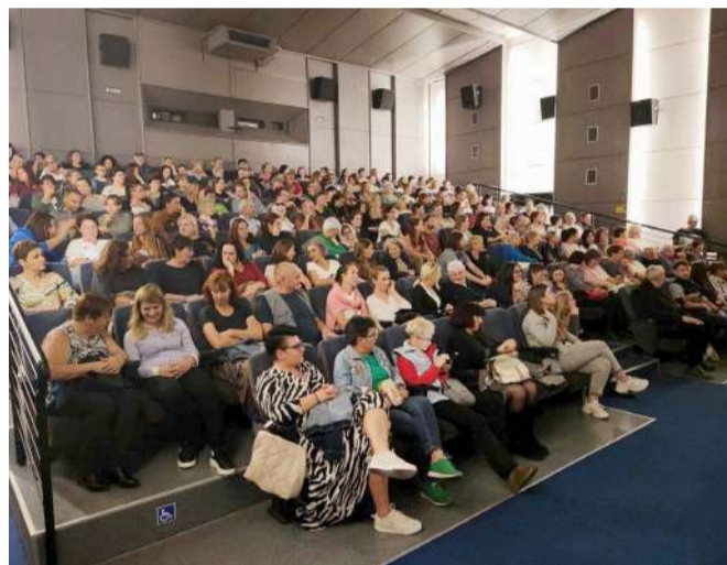
Megteltek a városi mozi széksorai