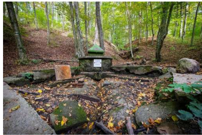
Varázslatos hely a Szent Miklós-forrás környéke

ágazóból induló mintegy 15 km-es táv szép és érdekes látnivalókat, nevezetességeket is tartalmazott. Ilyen volt a Szent Miklós-forrás, mely a Keszthelyi-hegység legnagyobb vízhozamú forrása és az egykori pálos szerzetesek által is használatos volt. A jelenlévők eljutottak a Balaton-felvidéki Nemzeti Park egyik eldugott látványosságához, a büdöskúti erdőrézshöz és a Szent Miklós-forrás között fekvő katonai kutyatemetőhöz is. Megállapították, az árnyas bükkfák között kialakított kis állattemető méltó nyughely a katonai rangot viselt 12 eltemetett katonakutya számára. Később a 408 méter magas Pad-kő csúcson álló Padkúti kilátó volt a célpont. A túra jelentős részben erdős területen vezetett, így a résztvevőknek lehetősége nyílt minőségi időt tölteni a szabadban, elcsende-