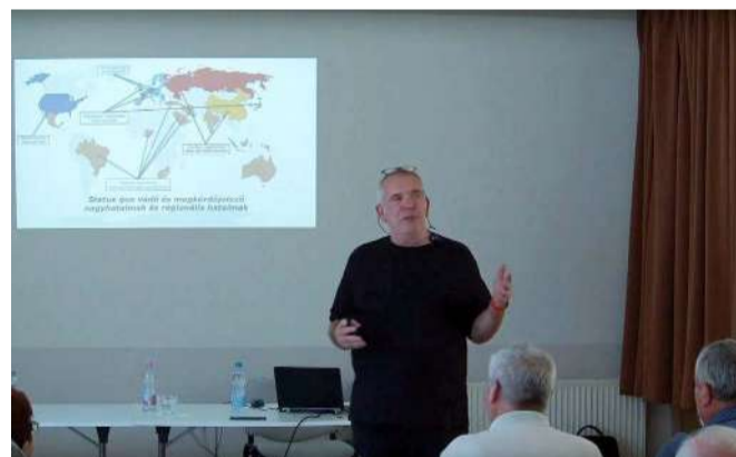
A világpolitika nagy kérdései kerültek terítékre

Európában látja a veszélyt, hanem Kínában, ezért az ő törekvéseit akarja megakadályozni. Biztonságunkat tehát magunknak kell szavatolni, hiszen egyre kevésbé számíthatunk az Egyesült Államokra. – tette hozzá a szakértő. Európa jelenleg nagyon gyenge. Ezt bizonyítja, hogy több ország is sze-