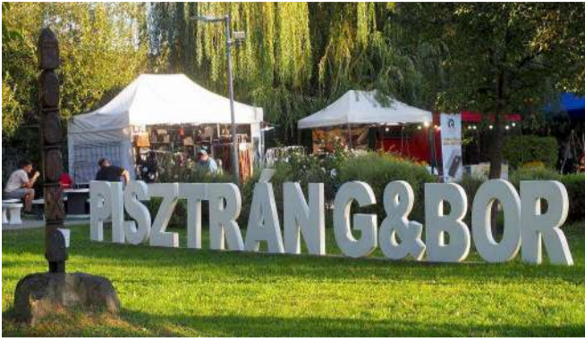
Az elmaradhatatlan óriás felirat a déli városkapunál

A rövid megnyitó ünnepséget kora este tartották az alsó-tónál, ahol Navracsics Tibor közigazgatási és területfejlesztési miniszter, a térség országgyűlési képviselője, Dobó Zoltán polgármester és Mezőssy Zoltán rendezvénygazda is köszöntötte a jelenlévőket, a fesztiválozókat, illetve a török testvérváros, Canakkale önkormányzatának küldöttségét.