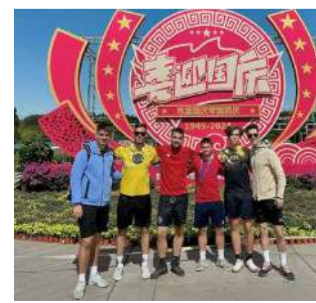
Az Infinity csapat öt versenyzője a kínai fővárosban

Ami még öröndetes hír, hogy a labdarúgás iránti szenvedély ezen az ágon a magyar játékosok szerepelnek az élvonalban. /ks/