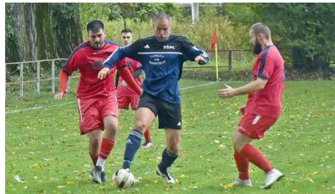
A játék fair play volt, de alulmaradtak a vendégek