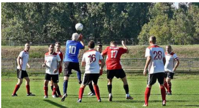
A korbeli különbségek kiütköztek a mérkőzésen

Vármegyei III. o. Dél Ligában, Kinizsi TE Nagyvázsöny csapatát fogadta a Tapolcai Öregfiúk, szeptember 22-én, a Városi Sporttelepen.