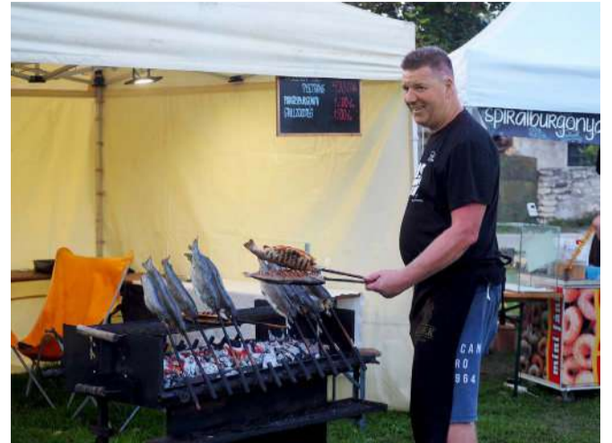
A parázson sült pizstráng a rendezvény szimbóluma

Navracsics Tibor a rendezvényt méltatva úgy fogalmazott, Tapolca az elmúlt bő tíz évben egy olyan eseményt épített fel és tett hagyományná, ami országosan még ismertebbé tette a város nevét. - Jókat enni és inni mindig a legjobb út ahhoz, hogy az emberek békében éljenek egymás mellett, fenntartva a jó kapcsolatokat. Én azt kívánom, hogy