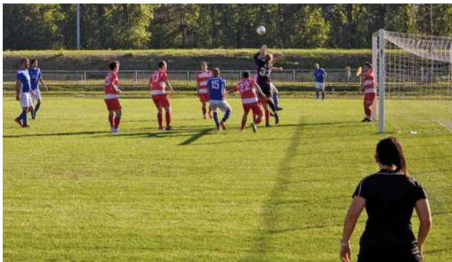
A tapolcaiak sikerei még váratnak magukra

A TIAC felnőtt csapata a Vármegye II. osztályában mérkőzött a Kamond FC-vel szeptember 22-én, a tapolcai Városi Sporttelepen.