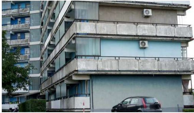
Az Y-okat érintő műszaki problémák megoldásra várnak