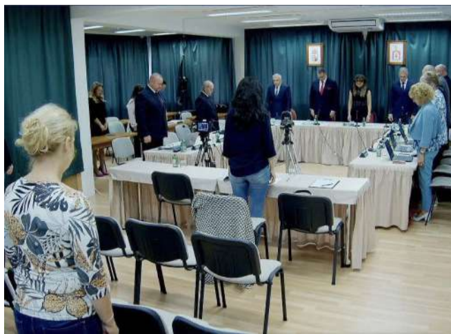
Egyperces néma főhajtás az elhunyt képviselő emlékére