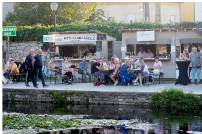
Idén is gazdag volt a kínálat a legjobb környékbéli borokból

A rövid megnyitó ünnepséget kora este tartották az alsó-tónál, ahol Navracsics Tibor közigazgatási és területfejlesztési miniszter, a térség országgyűlési képviselője, Dobó Zoltán polgármester és Mezőssy Zoltán rendezvénygazda is köszöntötte a jelenlévőket, a fesztiválozókat, illetve a török testvérváros, Canakkale önkormányzatának küldöttségét.