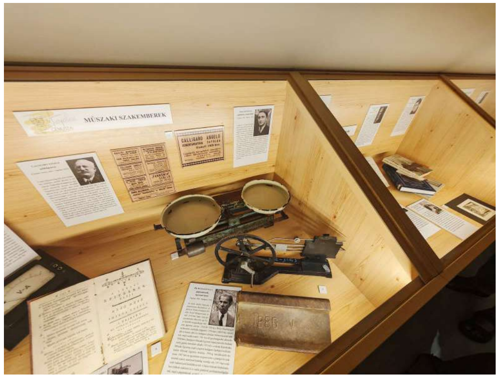
A vitrinekben életrajzok, továbbá a kort és a szakmát tükröző tárgyak kaptak helyet