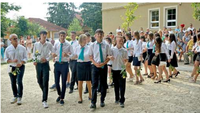
A Bárdos iskola udvarán sorakaznak fel a ballagók

Lezárult a 2023-24-es tanév, elballagtak a tapolcai végzős diákok, kitört a VAKÁCIÓ.