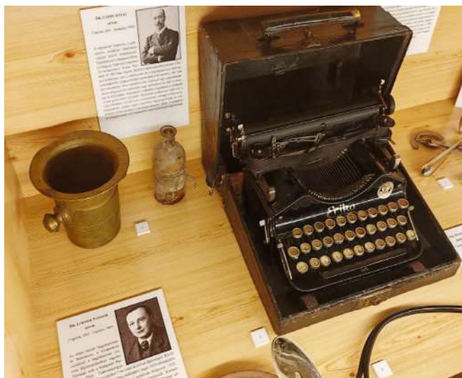
Nagyjaink és amivel a munkájukat végezték

írott és tárgyi emlékei is bekerülhetnek volna a múzeumi gyűjteménybe – hangsúlyozta az intézmény igazgatója. Dobó Zoltán polgármester köszönetet mondott az intézmény vezetésének, a beruházásban résztve-