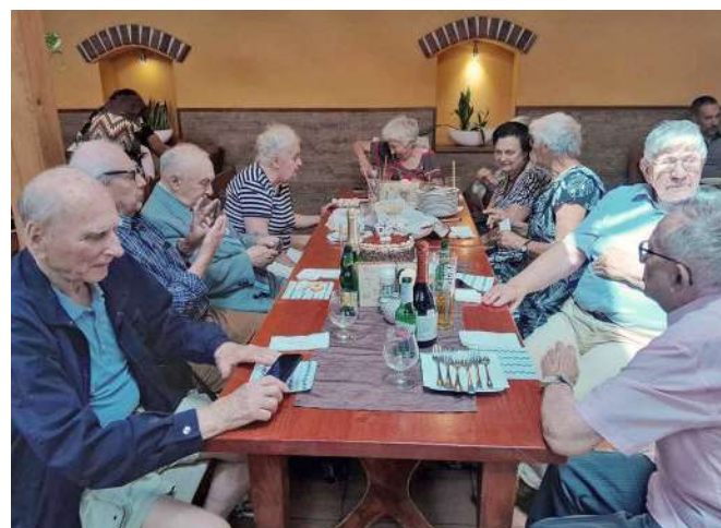
Közel hét évtizede érettségiztek, mára tízen maradtak

múlva a 70. érettségi találkozó! Adja Isten hogy így legyen! /tl/