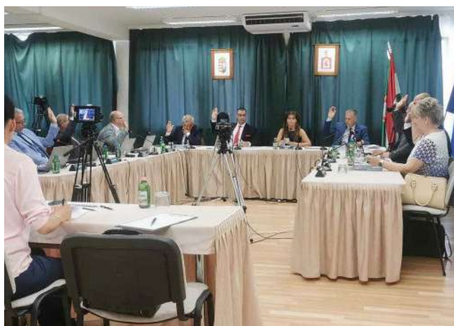
Szavaz a város képviselő-testülete

Teljes egyetértésben jóváhagyta a testület a Wass Albert Könyvtár és Múzeum keretei között működő tapolcai városi múzeum küldetésnyilatkozatát és stratégiai tervét a 2024-