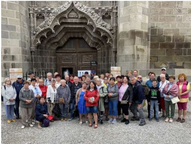
A brassói Fekete-templomnál készült a csoportkép