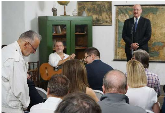
A kiállítótér átadásának pillanata az iskolamúzeumban

lalkozók végezték – tudtuk meg. – A már meglévő 130 négyzetméteres kiállítótér másfélszeresére bővült, illetve a pincétől a padlásig immár három szinten tudunk kiállítási látványokat kínálni – hangsúlyozta dr.