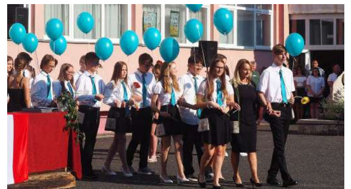
Idén is kék lufikkal ért véget a tanév a Kazinczyban