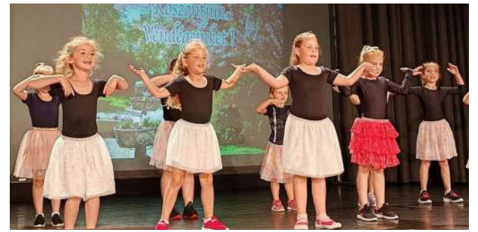
A legkisebbek csalják a legtöbb mosolyt az arcokra

A táncosok 22 produkcióval készültek a szülőknél, ismerősöknek, akik kitörő tapsal fogadták a táncos számokat. A legkisebb lurkóktól kezdve az iskolásokig, minden korosztály képviselte magát ezen a programon, amely mosolyt csalt mindenki arcára.