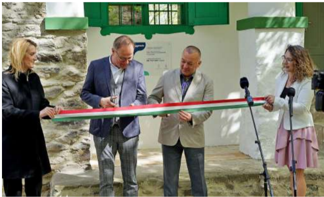
Igényesen újult meg, a napokban átadták az épületet

tatt a projektet nehezítő, hátráltató körülményekre is, ugyanakkor köszönetet mondott minden segítőnek, támogatónak. Dr. Navracsics Tibor miniszter arra világított rá, hogy Trianon után egy élni akaró nemzet megnézte, hogy mi maradt neki és felfigyelt azokra a kincsekre ami a megcsönkített Magyarországon természeti értéknek rendelkezésre állt. – Így került fókuszba a balatoni, Balaton-felvidéki turizmus, megszületik a kék túra, turistaházak létesülnek a két világháború közötti időszakban, majd folytatódik mindez a világháború után is – helyezte történelmi környezetbe a hazai turizmus alakulását, fejlődését a miniszter. Navracsics Tibor hangsúlyozta, a közérdek megvalósulásáért áldozatot kell hozni, amire szép példa a Kaán Károly Kulcsosház megújulása. A politikus további "természet és tájazonos" turisztikai fejlesztéseket is előrevetített a térségben, azzal a reménnyel, hogy azoknak a jövőben mindenki nyertese lesz.