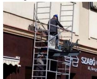
A felszerelés munkálatai a Postaudvar bejáratánál

relhessék a lovas postakocsit ábrázoló, tömör rézből készült mives cégért. Az udvarban a hetvenes évek második feléig működött postahivatal, ám annak megszűnése után, a bejárat fölött még évtizedekig ott díszelgett a „műemlék”. /tl/