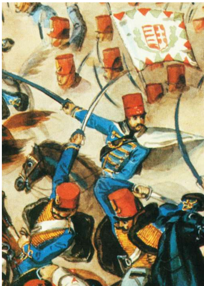
Huszár attack a szabadságharc idején