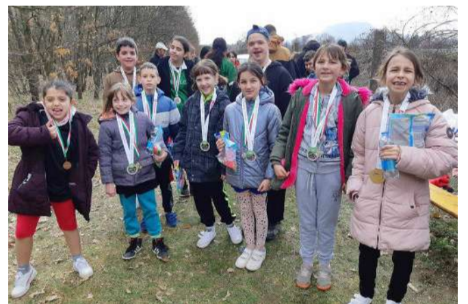
Ők már szerepelhetnek a diákolimpián

A Szász Márton Általános Iskola diákjai ismét kiemelkedő eredményeket értek el a 2024. március 13-án megrendezett diákolimpiai mezei futóverseny megyei fordulóján, amelyen Ajka, Pápa, Várpalota, Tapolca futói vettek részt.