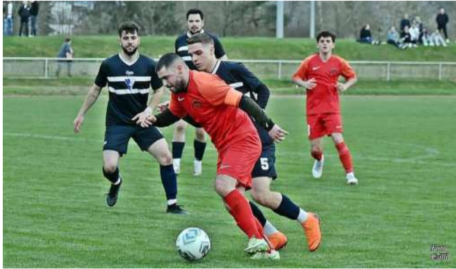
Lendületes játék Balatonszepezden

A Kamond elleni döntetlen után, március 23-án, bizakodva léptek pályára a tapolcai "ifjak".