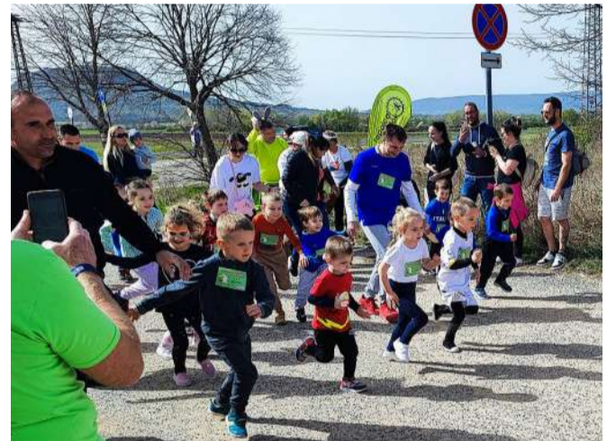
A cél, hogy megszeressék a futást a kicsik is