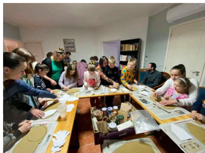
A kézműves foglalkozás egy pillanata