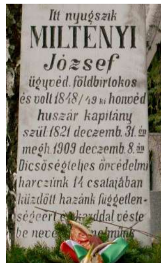
A kapitány sírfelirata

szabadságharcos áldozatvállalásának emléke mindmáig elevenen él Tapolcán. Emlékezete korszakokon, politikai kurzusokon átívelő, időálló életút példának bizonyult, 1945-ön innen és túl, rendszerváltozás előtt,