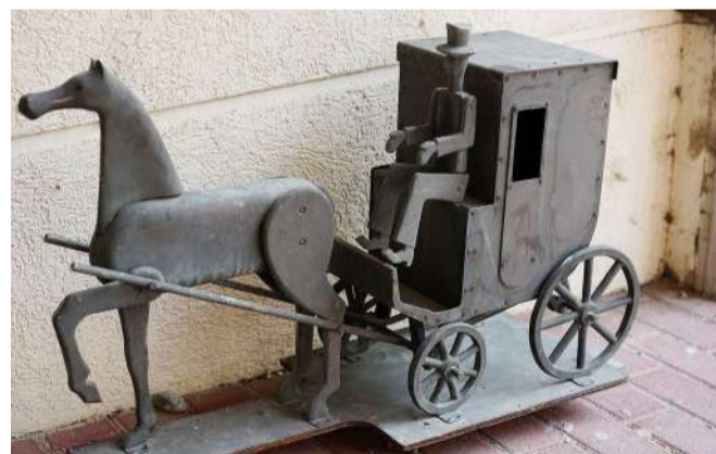
Rézből készült a korabeli postakocsi modellje

A város önkormányzata március 27-én visszahelyeztette eredeti helyére a régi postaudvar valamikori patinás postacégéret és a hozzá tartozó réz feliratot.