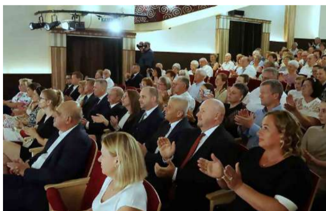
A város frissen megválasztott képviselői a nézőtérén

a város minden lakójára. A rendezvény polgármesteri pohárköszöntővel és svédasztalos vacsorával folytatódott. /Írás, fotó:tl/