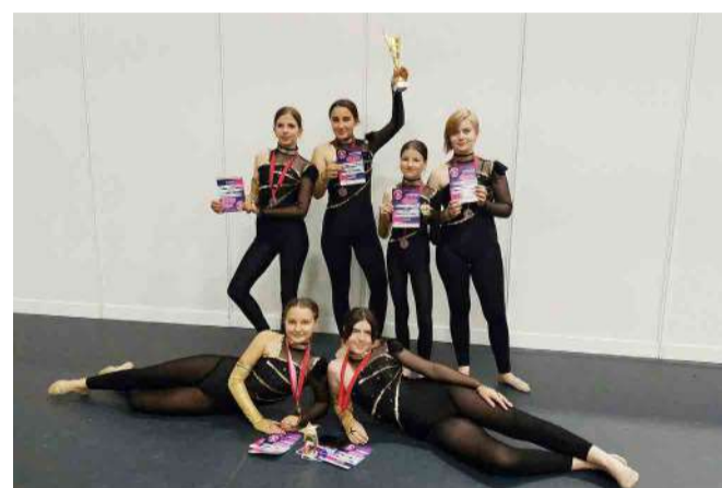
A Nagyboldogasszony iskola boldog bronzérmesei

Harmadik helyet szerzett Zalaegerszegen, az Albatrosz Nemzetközi Minősítő Táncversenyen a Nagyboldogasszony Római Katolikus Általános Iskola mazsorett csapata, a Tapolcai Mazsorett és Zászlóforgató Csoport június elsején.