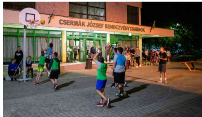
Idén Tapolca is részt vett az országos programban

A tapolcai sportesemények között válogatók szemezgethettek meghatározott, rövidebb időintervallumban, vagy akár