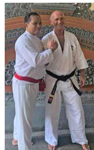
Együtt a balinéz és a magyar mester Fotók: helysz.