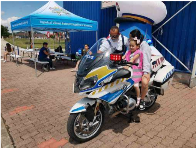
A rendőrmotoron ülni mindig nagy élmény

A Tapolcai Rendőrkapitányság saját kezdeményezéseként összefogott a helyi Tescoval és közlekedésbiztonsági rendezvényt rendezett a hipermarket parkolójának egy részét gyermeknap alkalmából, június 2-án.