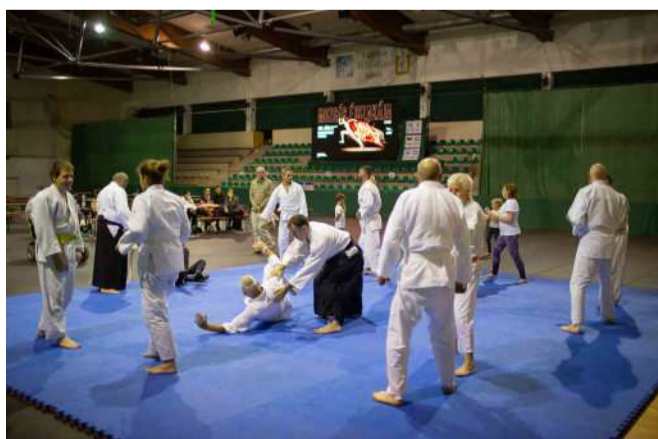
Bemutakoztak a küzdősportok is a rendezvényen

csarnok előtt és környékén. A leglassabb vérmérsékletet igénylő jógától, a karatén át a futásig több, mint 10 sportággal ismerkedhettek meg, illetve próbálhatták ki magukat a mozogni vágyók. Az érdeklődők több órányi elfoglaltságot kaptak, miközben a büfében felfrissülhettek és nézhették a foci Eb-t a csarnokban lévő ledfalon. Jövőre is legalább ennyi programmal szeretnék megmozgásra bírni mindenkit a szervezők, reményeik szerint még több résztvevővel.