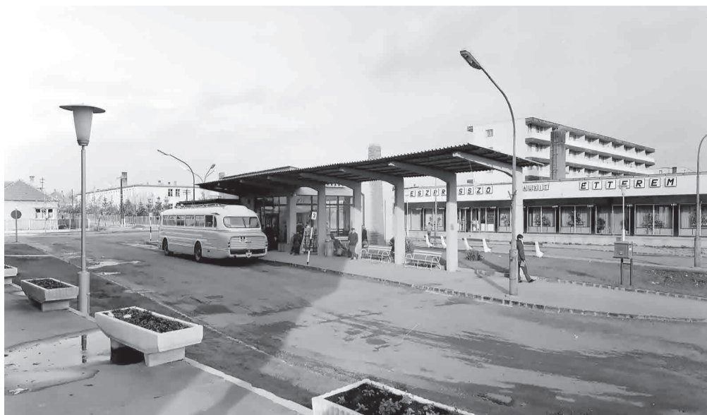
A tapolcai buszpályaudvar a 70-es években a legendás „faros” Ikarussal

• K ü l ö n l e g e s , korszerű MEDICOR-panelműtöt adtak át a tapolcai városi kórházban. A vasváza szerelt, rozsdamentes acélpanelekből összeállított műtő a koráb-