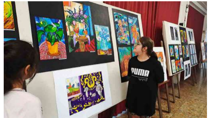
Egy helyen a tehetség és a tudás eredménye

megvalósítását 2024. évben a Magyar Művészeti Akadémia támogatta." A fenti szakmai program új szintre vitte az intézmény művészetoktatási gyakorlatába, olyan friss kifejezési lehetőségeket tárt fel a diákok számára, amelyben a legkisebbektől a legnagyobbakig mindenki megtalálhatta a készségeit, személyiségét gyarapító feladatokat, gondolatközlési lehetőségeket. A tanév végi rendezvények megszervezése, a kiállítások és a tárlatvezetéssel egybekötött értékelések Tapolca Város Önkormányzatának támogatásával valósulhattak meg. A művészeti iskolának kiállítása nyílt Tapolcán a Kazinczy Ferenc – és a Nagybol-