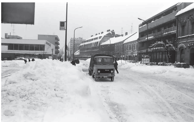
1987 tele Tapolcán, talán azóta sem láttunk annyi havat