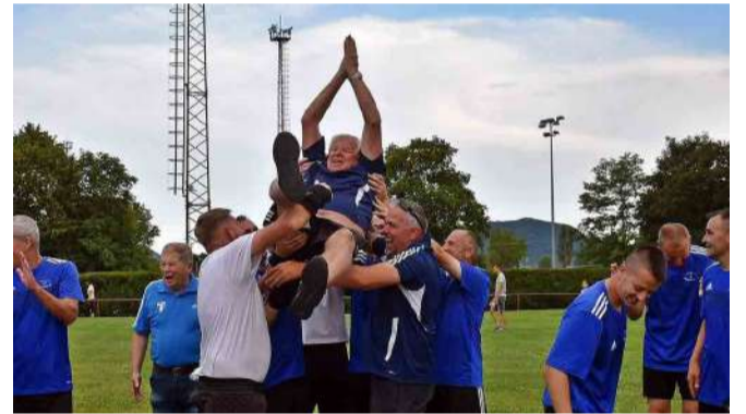
Öröm a pályán, bajnok a TÖFC

Összességében a tapolcaiak fair play játékaról és összeszedettségéről ad tanúbizonyságot egyrészt az a tény, hogy kiállítás nélkül játszották végig a szezont, másrészt a mérlegük, a hűz győzelem mellett, mindösszesen három döntetlent és három vereséget szenvedett el a csapat, ami példás teljesítmény. Tapolcai ÖFC - Révfülöp NKSE 1-1 (1-0) /ks,