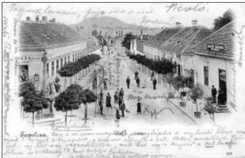
A Fő tér és a Batsányi utca találkozási pontja a XIX. század végén