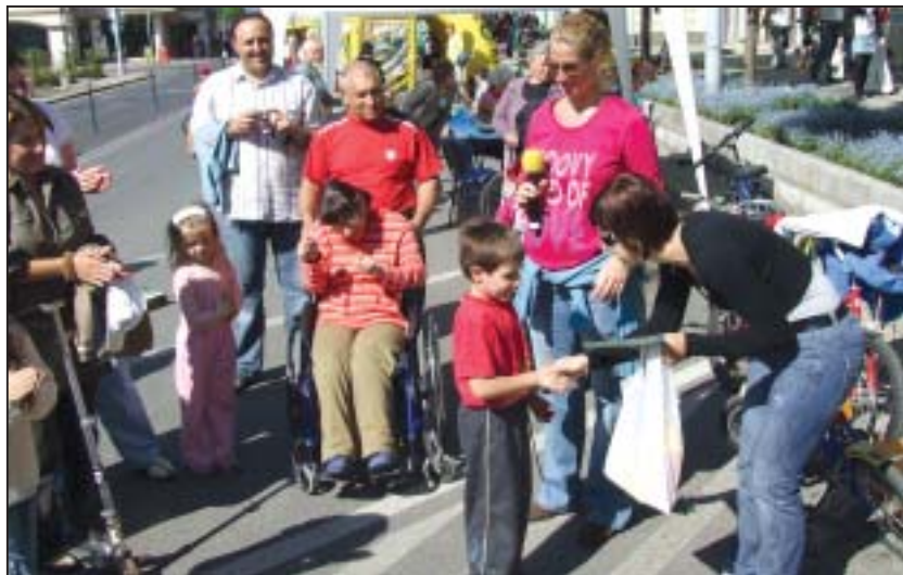
Napfényes városközpont és sok program várta az érdeklődőket

A Tegyünk a Földünkért! rendezvény-sorozat április 6-tól június 5-ig tart.