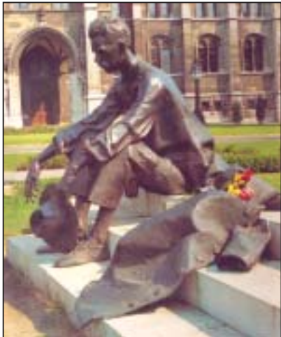
„A rakodópart alsó kövén ültem, néztem, hogy úszik el a dinnyehéj.”

1980 - A Parlament déli kapujánál elhelyezték A Dunánál című szobrát.