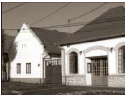
A szülői ház és a kovácsműhely ma

„Egyszerű, gerendás mennyezetű, kicsi szoba. A falakon temérdek festmény és rajz. A szoba különböző pontjain kis- és nagyméretű szobrok, agyagból mintázott figurák. A betűző napfény ragyogóvá törik meg „Árpád Vezér” erőteljes alakján, majd csillogva veszi körül Mária Terézia lovasszobrát.