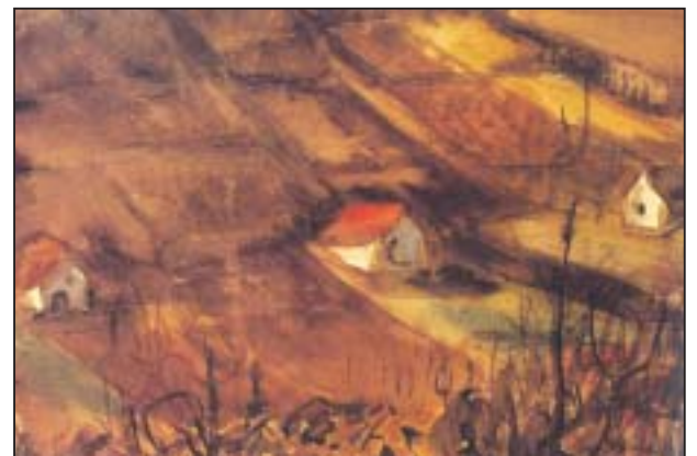
Véndekhegy márciusban /1944/

„Már több mint 400 akvarellem van. Nem tudok megenni festés nélkül. Mindig a pillanat dönti el, hogy mit festek. Szeretem a vizet, az eget, a tájt, az embereket, a városok egy-egy részletét. Szeretem rajtuk keresztül megjeleníteni az életet. Engem a látvány érdekel, a valóság ezerarcúsága. Az ihlet az igazi tehetség egyik ismérve. Aki tehetséges, nem szabadulhat tőle. Olyan ez, mint az alkoholizmus, nem enged, fogva tart, megszállottá tesz. Ha nem dolgozik az igazi művész, akkor megfullad. Ha nem „teremthet” azonnal, akkor is baj van. Az Isten-adta tehetséghez azonban hatalmas alázatra, akaratra és szorgalomra is szükség van, mert máskülönben elvesz a művész.”