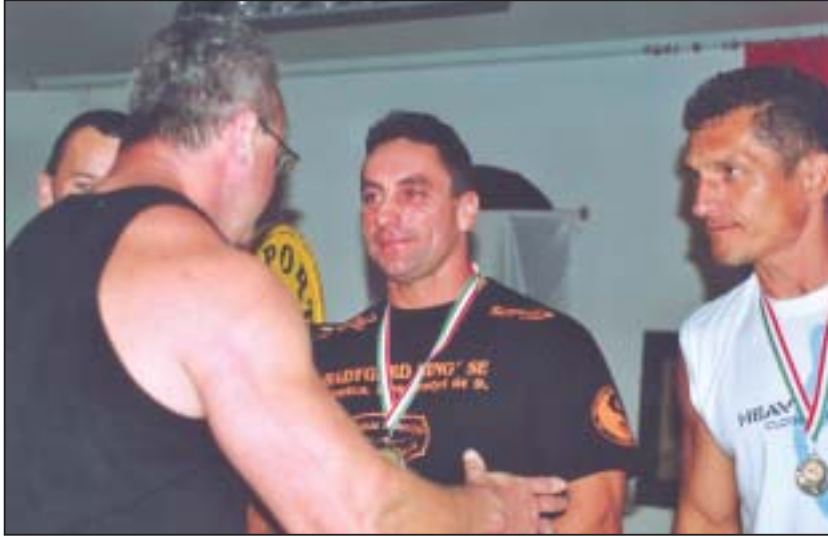
Töretlenül a sikerek útján