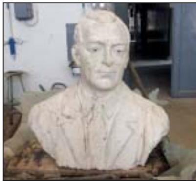
Wass Albert mellszobra