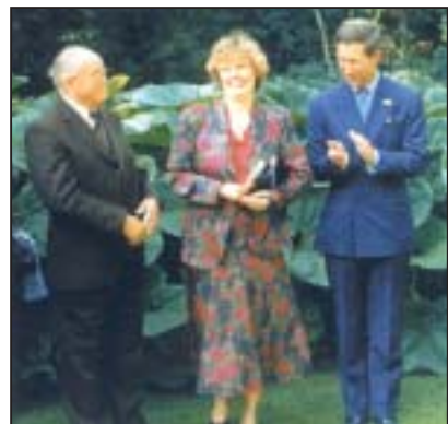
Károly walesi herceg vendége volt a művész és felesége

1993 - A brit trónörökös, Károly, walesi herceg meghívta a művészt és feleségét highgrove-i otthonába.