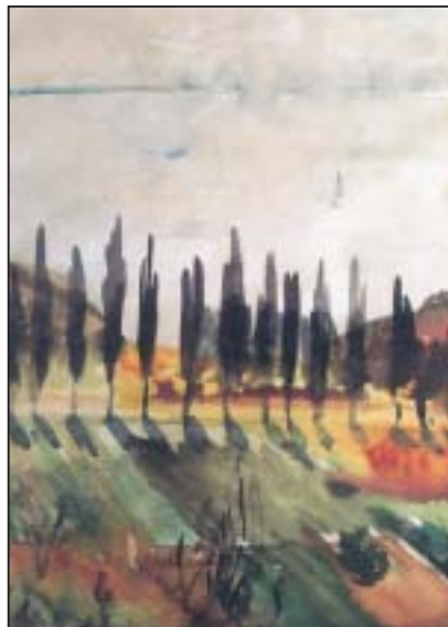
Szigligeti jegenyefák /1957/