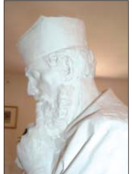
Nepomuki Szent János