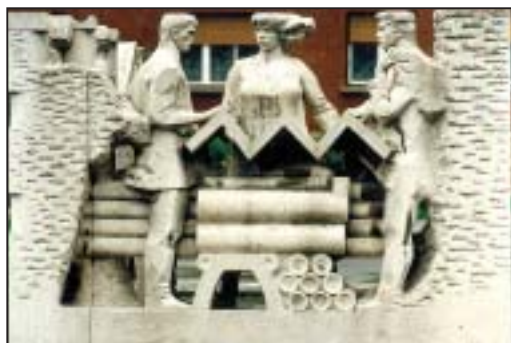
Memento: Tapolca bányászváros volt

Szent Borbóláról , a bányászok védőszentjéről mintázott csodálatos lányalak a Tamási Áron Művelődési Központ előtt áll. Kezében a természet erőinek kiszolgáltatott bányász örök jelképét helyettesítő méccset, és a győzelmet hirdető palmaágat helyezte el a művész.