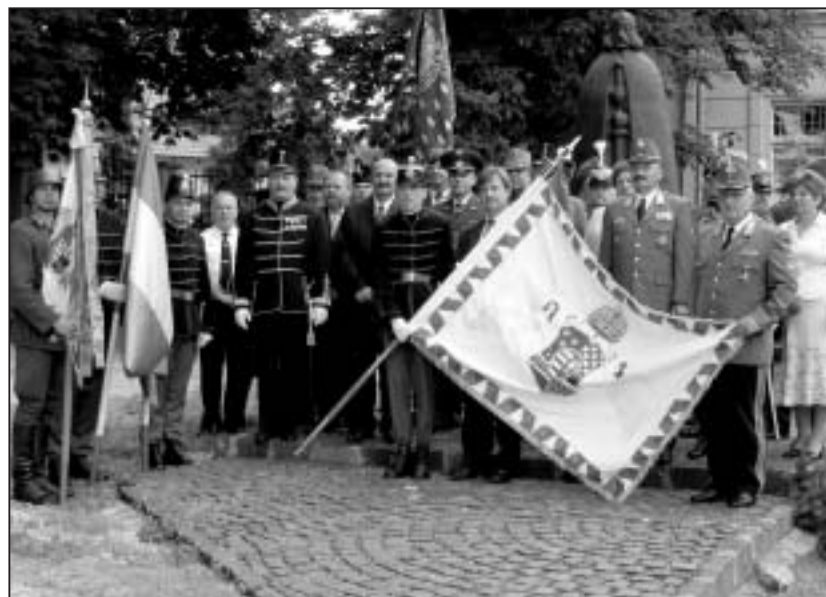
Szent István szobra előtt a megáldott zászlóval