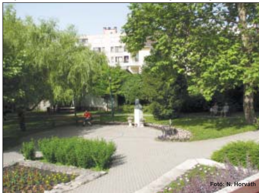
Tapolca várja a vendégeit