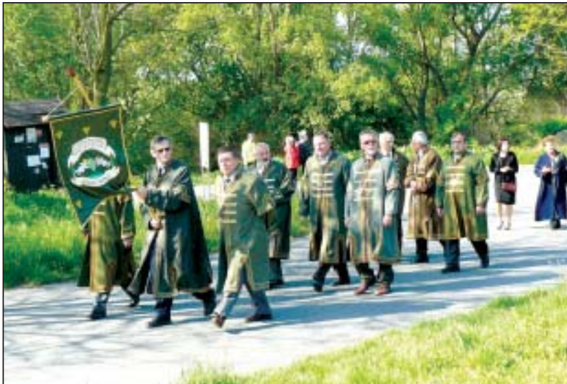
A Vinum Vulcanum Borlovagrend tagjai a felvonuláson