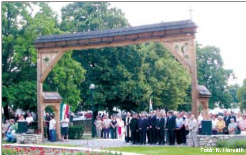
„Isten, áldd meg a magyart // Jó kedvvel, bőséggel,”

A gyászünnepnek méltó keretet adott a M. Kir. I. Ferenc József Jászkun I. Honvéd Huszárezred Hagyományörző Egyesület, valamint a Tapolcai Honvéd Kulturális Egyesület díszőrsége. NHE