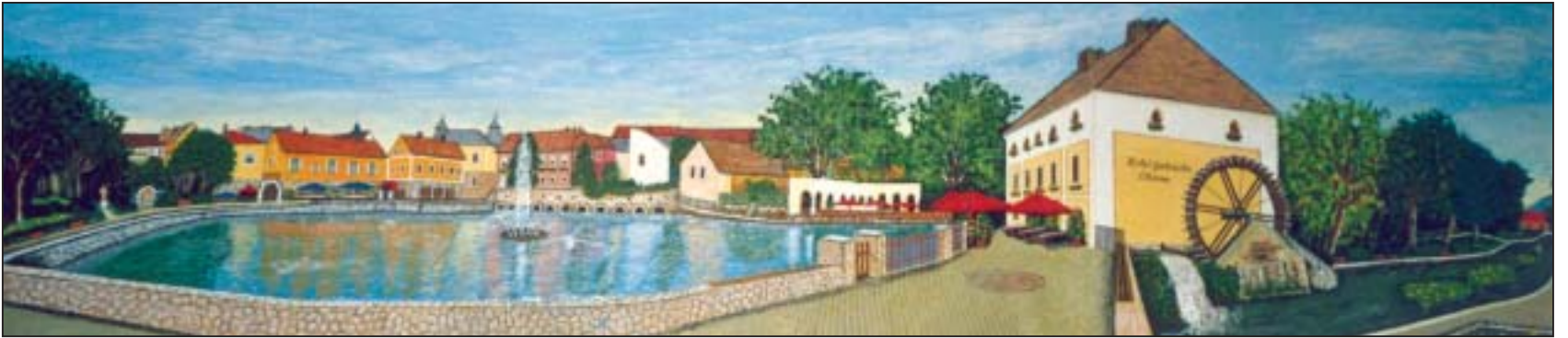
Tóth Róbert, tapolcai amatőr festő alkotása