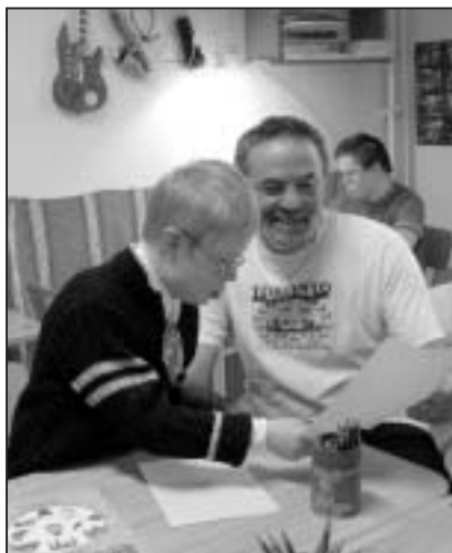
A személyes példa a legnagyobb fegyverem erő

- Tudom ezt én is. Az osztálytalálkozónkon is látnom kellett, hogy rajtam kívül szinte senki sem maradt a pályán, pedig ha valahol, akkor itt nagy szüksége lenne a gyerekeknek arra, hogy férfi tanármodellrel is