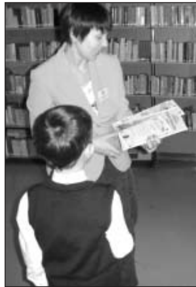
A könyvek birodalmában