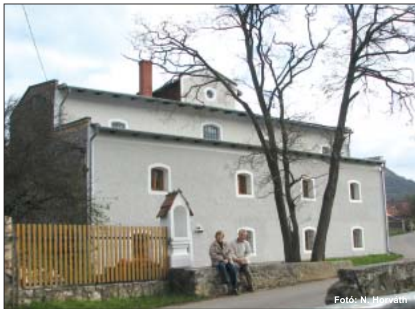
Lassan megvalósul az álom

- Nem tűztünk ki határidőt. Tíz éve csináljuk. Saját erőből. Sokáig - míg nem lettem nyugdíjas - munka mellett, hétvégén, a szabadság ideje alatt. Ha nem lenne ilyen nagyon erős az érzelmi kötődésünk, akkor már régen abbahagytuk volna. De mindemellett motiválnak bennünket a diszeliek is. Nagyon sok elismerést, tanácsot kapunk tőlük. Sürgetni azonban nem tudjuk a munkálatokat, az anyagiak erősen befolyásolják a végkifejeletet. De Madách után szabadon: Nem a küzdés, hanem az építés az élet célja maga. Útközben lenni is jó, nemcsak megérkezni.