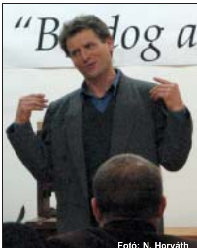
Lássuk, hogy készült a Vizsolyi Biblia

lelkesedése bizonyítja, hogy megtalálta a helyét.