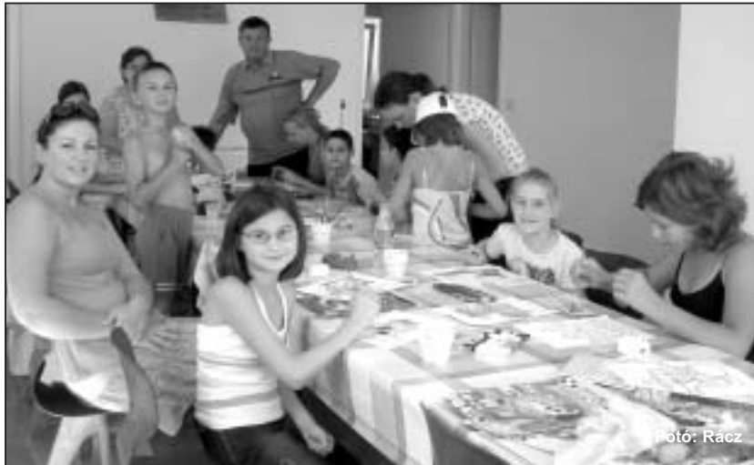
Az erdélyi gyerekek nagyon élvezték a kézműves foglalkozásokat

- Az volt számunkra a szívmengető, hogy láttuk, mindenkiben van jóság, hogy akárhová mentünk, a gyerekek mindenkiből előcsalogatták a szeretetet, az adakozás örömét. Lehet, hogy patetikusan hangzik, de úgy éreztem azokban a hetekben, hogy a szívek találkoztak. Már az Életértékek Alapítványt is azzal a céllal hoztuk létre, hogy a rászoruló tapolcai és környéki, valamint az erdélyi gyerekeket segítsük, de hála Istennek, a segítségnyújtás túlnőtt az alapítványi kereteken. A tapolcai Déva Vár Kör ma már közel kétszáz jószándékú embert számlál. A kisiratosi adománygyűjtés gondolata a gimnazisták körében született. A televízióban és az újságban közzétett felhívásra nagyon sokan jelentkeztek. Az adományok átadásáról egy diáklány filmet készített. Ezt nemcsak a televízióban vetítették le, de a katolikus iskolában is bemutattuk az