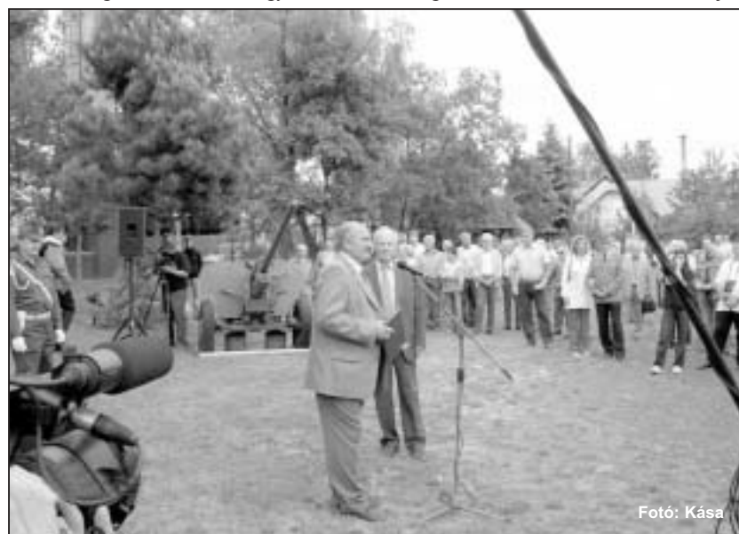
Az MN 1480 Rakétadandár 2007. május 12-én megcselekedte, amit elfelejtett a hazai!

nagyszerű emberekkel, az anyagi elismerés sohasem volt megkülönböztetett, ezt a munkát csak megszállott emberek tudták végezni.