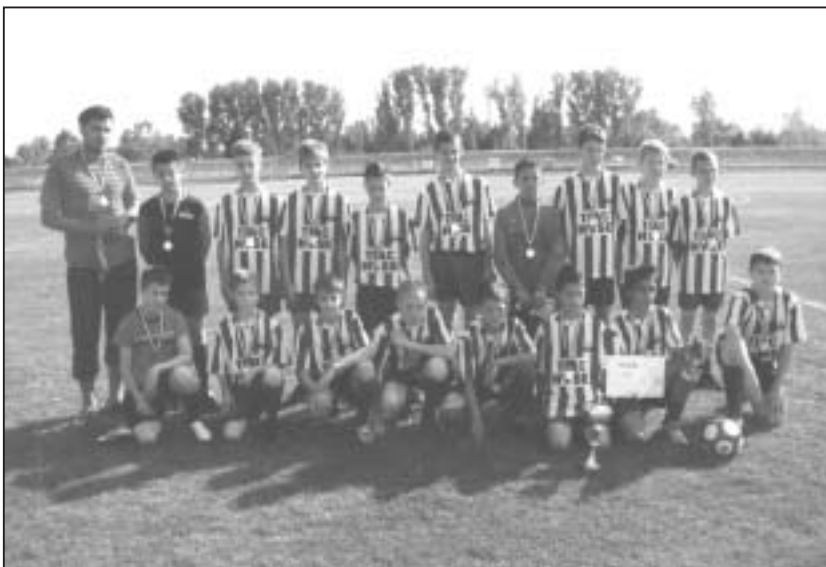
A TIAC U13-as csapata

Szuper Kupa: NB II-es Ifjúsági Bajnokok Tornája Tapolca. 5 csapattal, mert