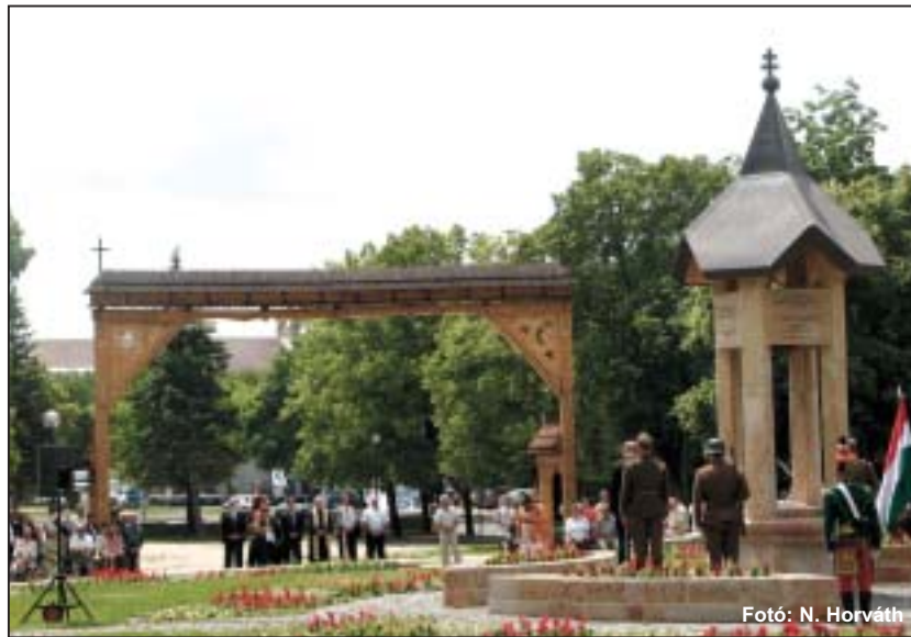
Az együvértartozás szimbólumai a Köztársaság téren

Németh Zsolt, hangsúlyozta a máig ható káros következmények közös felszámolásának szükségességét. Idézte Bibó Istvánnak a kelet-európai kisállamok nyomorúságát