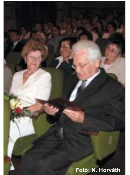
Az első diploma átvételétől 70 év tel el

- 1954-től tanítok Tapolcán. Először a leányiskolában, majd ennek jogutódjában, az 1. számú Általános Iskolában folytattam a pályámat igazgatóként. 1978-ban mentem nyugdíjba, de utána még nyolc évig óraadóként tanítottam a gimnáziumban.