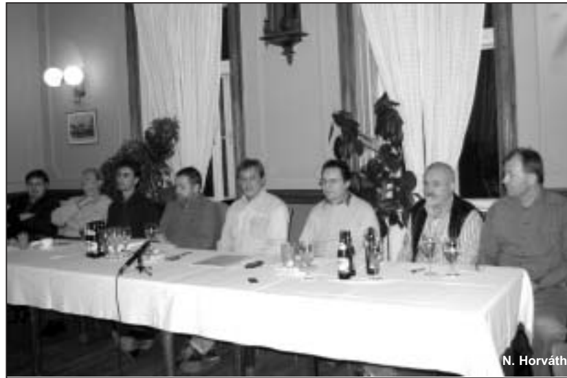
Az összejövetelen a vállalkozói kérdésekre válaszolva szó esett még a DRV Zrt. privatizációjáról, az Ipar utcai fejlesztésekről is

„Közoktatási Infrastrukturális Fejlesztés támogatására” címmel kiírt pályázati felhívásra benyújtotta a pályázatát. De beadásra került a Tapolca-Diszel kerékpárút II. ütemének a megvalósításához szükséges pályázat is. Az egymilliárd forint értékű kötvénykibocsátás a város fejlesztését, fejlődését lesz hivatott szolgálni - hangsúlyozta. Az alpolgármester a laktanyai ingatlanok hasznosításáról szólva leszögezte, hogy az önkormányzattól független, adminisztratív tényezők hátráltatják ennek megvalósítását. - A mentőállomás beköltözik a kórház területére - hívta fel a jelenlévő vállalkozók figyelmét - így a volt 4250 m 2 -es állomáshely kiadó vagy eladó lesz.