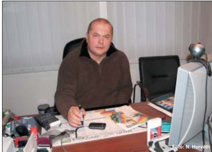
A túlélés stratégiája a fejlesztés

olyan közéleti szereplőket az összejöveteleire, akik a megyét, a várost érintő kérdésekre tudnak választ adni, de olyan szakemberek is gyakran tartanak előadásokat, akik a törvényi szabályozásról, a járulékfizetés rendjéről is szólnak.