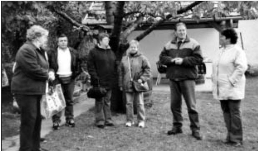
Barátok egymás közt

- Már körvonalazódik a jövő évi tervünk. A finn vendégek ebben az évben már részt vettek a Szent György-hegyi Napokon, nagy élmény volt számukra a borfelismerő verseny. Jövőre már harminc fő részére foglaltak szállást erre az időszakra a Gabriella-szállóban. Májusra egy meghívás érkezett Lempääläből az Ablak Európára program keretében Magyarországra. A tapolcai Batsányi Együtttest és a Baráti Kör elnökét, azaz engem hívtak erre az ünnepségsorozatra. A Társaságunk