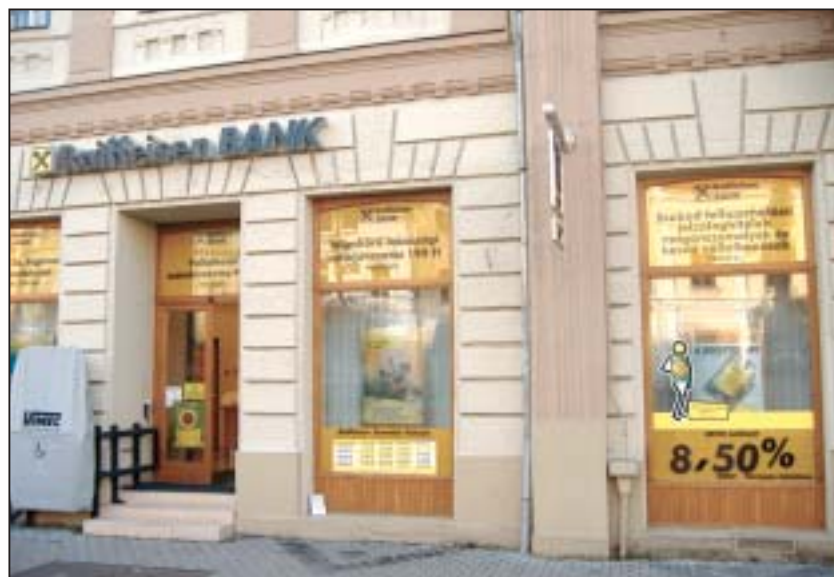
Két éve a lakosság szolgálatában

A legkisebbekről sem feledkeztünk meg a gyereksarok kialakítása által. A szülők nyugodtan intézhetik bankügyeiket, míg gyermekük játékkal tölti az időt. Az évforduló alkalmából ezúton is köszönöm minden kedves ügyfelünknek, hogy szolgáltatásainkat igénybe veszik és remélem, hogy e sorok olvasói közül is minél többen keresik fel a jövőben bankfiókunkat Tapolcán a Fő tér 4-8. alatt - mondta befejezésül a fiók igazgatója. (x)