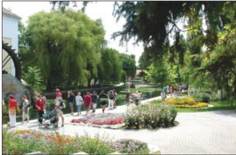
A virágok meghálálják a befektetett munkát