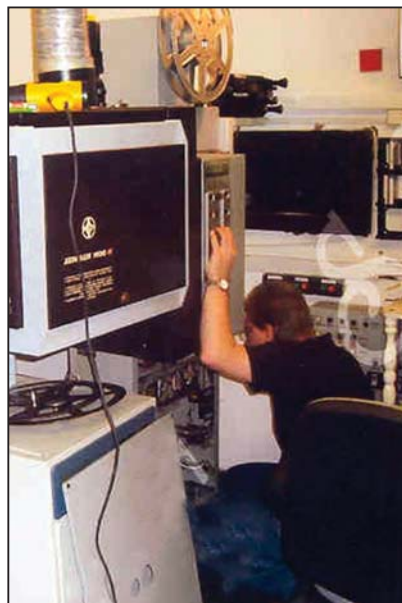
A XXI. század hangtechnikáját szerelték be a helyi moziba

jelentős változás, amelyeknél a szerzők már a készítés során kiemelt szerepet szántak a