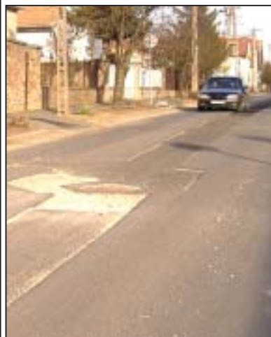
A közlekedést a csatornázás miatt kiasott, majd visszatemetett és megsüllyedt felületek nehezítik

Ugyanakkor jó hír, hogy a Fő utcán, a Kossuth utcán már elkészült a teljes körű felújítás. A város kezelésében lévő, közel 50 kilométeres szakaszból tavasszal 15 kilométeren útburkolatserére kerül sor.