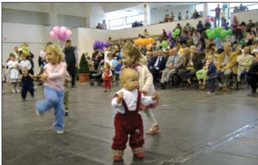
2005-ben a Pannon Reprodukciós Intézet nagyszerű babatalálkozójának is a rendezvénycsarnok adott otthont