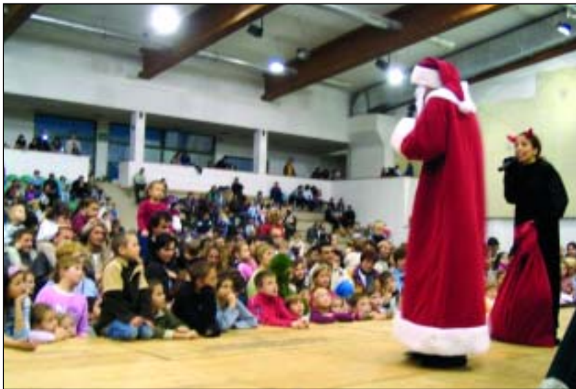
A Télapó minden évben eljön...

Hétfőn a Mikulás ellátogatott a T-Egyél Klub tagjaihoz és a kondicionáló tornára járó hölgyek közé is. GB