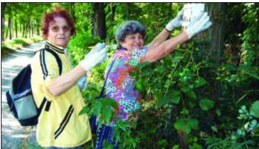
A Vállus - Lesenceistvánd - Tapolca - Szent-György-hegy - Szigliget - Badacsonytördemic 29,4 km hosszú útvonal felújítását kapta meg szakosztályunk

Az ideai esztendőben az Országos Sporthivatal a teljes úthálózat felújítását tűzte ki célul, pályázati forrást biztosítva a munkálatok elvégzéséhez, amire a Magyar Természetbarát Szövetség kapott megbízást,