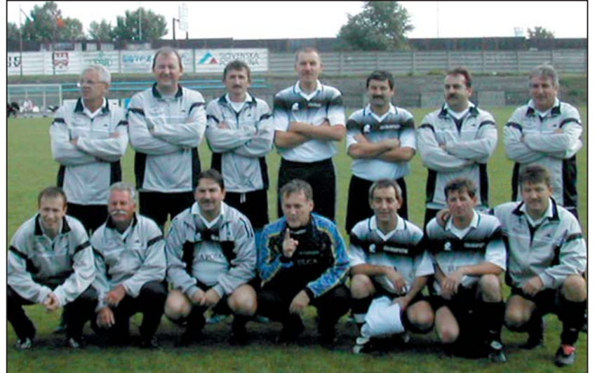
10 év alatt a csapat magja - kisebb változásoktól eltekintve - változatlan maradt

- Igen. Ilyen felkérést mindig szívesen vállalunk. Bevételeinket az asztmás gyerekek gyógyítására és a Városi Rendezvénycsarnok számlájára utaltuk.