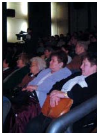
Az átalakított mozi közönsége örömmel vette birtokába a felújított intézményt

Jeles kulturális esemény volt Tapolcán március 3-án.