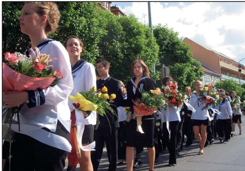
Míg a középiskolások egy része saját intézményében, addig a gimnázium tanulói a Városi Rendezvénycsarnokban folytatták tovább az ünnepséget