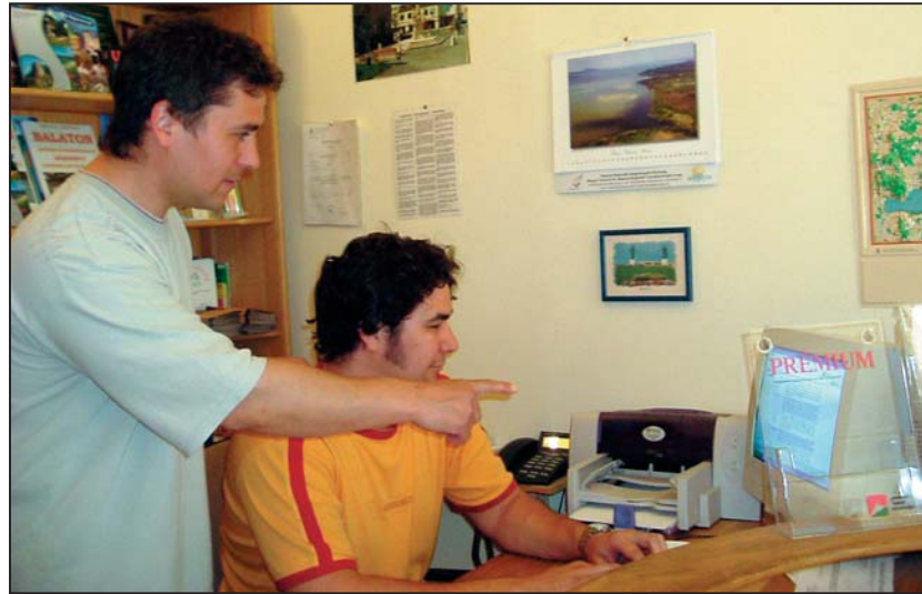
Számítógépes adatbázis köti össze a Tourinform Irodákat

- Nagyon jó. Sokan kérik tőlünk, hogy segítsünk a program-kiválasztásban, illetve ajánljunk programokat azokra a területekre,