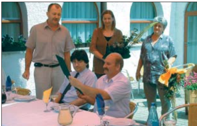
A kitüntetéshez a munkatársak is szívből gratuláltak

- Úgy tesszük tovább a dolgunkat, mint eddig: keményen, de szeretettel és