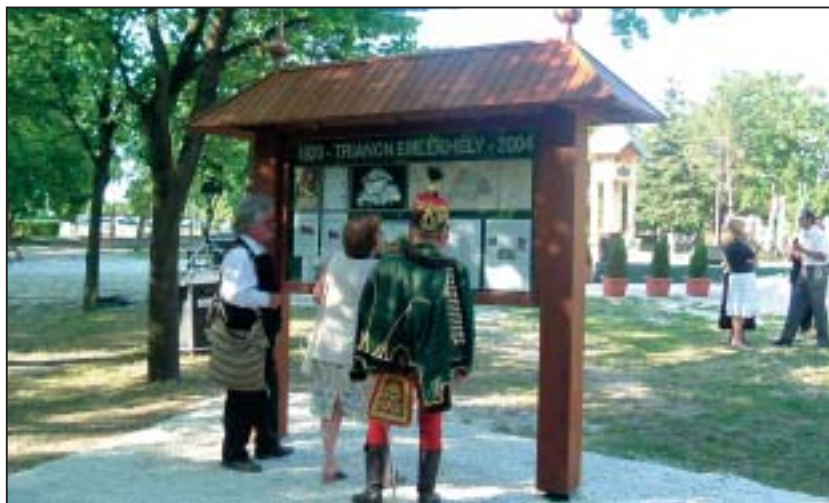
Élő történelem. A trianoni tragédiához vezető út stációi a kiállított dokumentumokon, térképeken keresztül is nyomon követhetők

/Összeállításunk a 3. oldalon Trianon igazságtalansága napjainkban is kísért címmel./