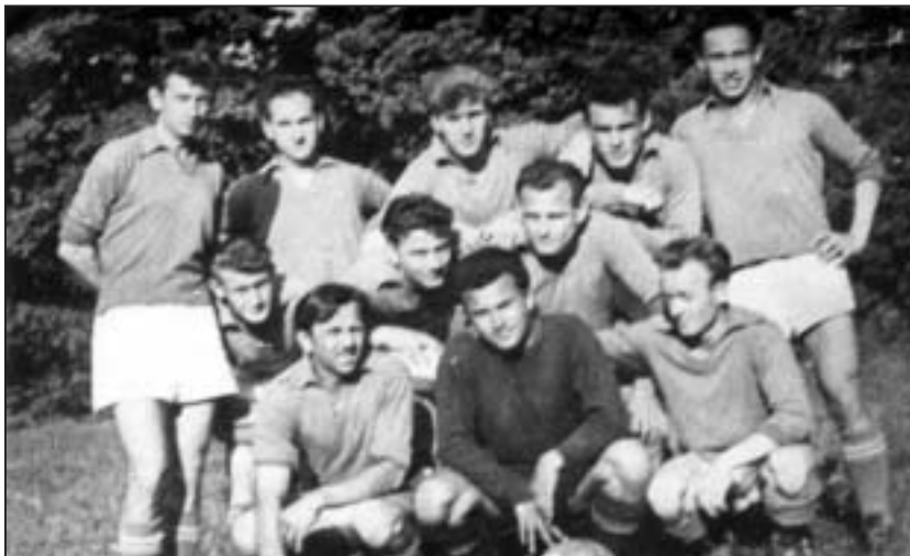
Régi idők focija

Az első világháború a sportéletet is megszakította. Az emberek figyelme másra irányult és csak a Tanácsköztársaság idején