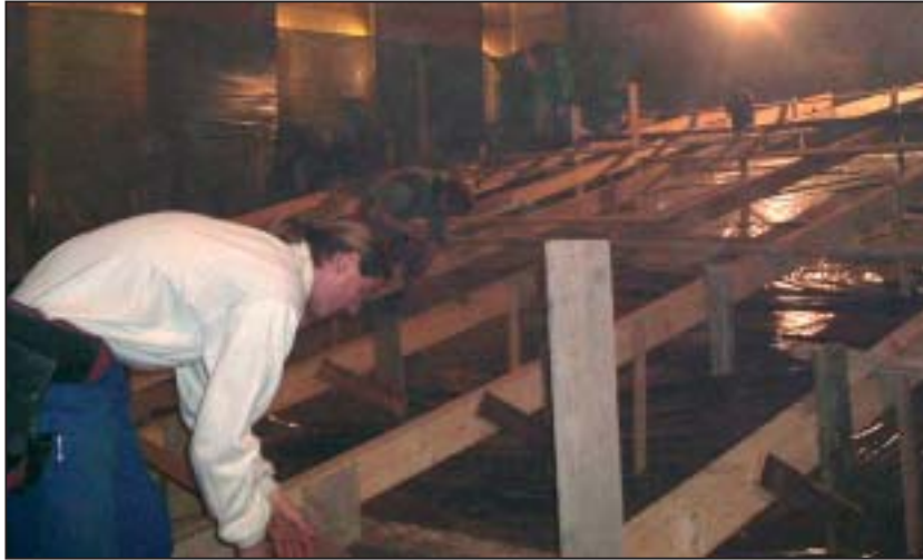
A mozi reklámozására 400.000 forintot nyert pályázaton az intézmény

Bár némileg csökkenni fog a nézőtér befogadó-képessége - 152 ülőhely lesz -, de a megemelt széksorok, a sorok közti távolság növelése és nem utolsósorban a kényelmesebb székek is segíteni fogják a filmélmény befogadását.