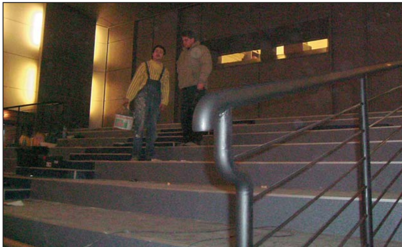
Már csak a székek beszerelése van hátra

Már csak néhány nap, és a Városi Mozi megújult nézőtérrel újra várja a mozikedvelő közösséget.