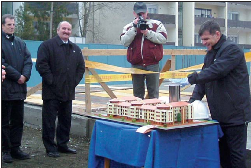
A földszinten lakások, illetve az utcafronton garázsok lesznek