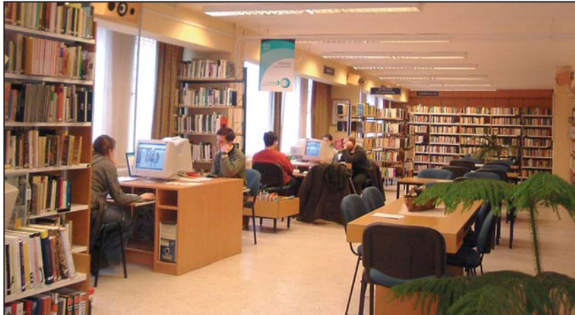
Közkedvelt a könyvtár internetes szolgáltatása

A számítógépek segítségével mód nyílt arra, hogy egyéb szolgáltatásokkal is ismerkedjenek a jelenlévők. NHE