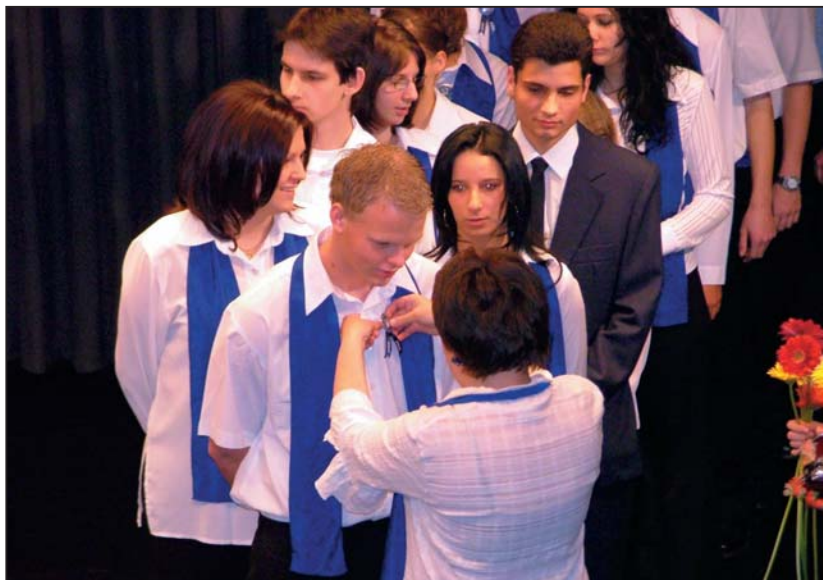
Az iskola névadójának képével ellátott szalag különleges dísz a végzősök ruháján