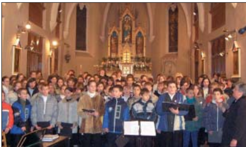
A Cecília-koncert másfél évtizedes múltra tekint vissza