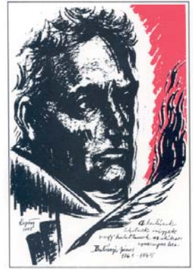
Batsányi János (1763-1845)

A Tapolcai Füzetek sorozat 24. köteteként Keresztury Dezső Batsányi Jánosról írt könyvét jelentette meg nemrég a Városszépítő Egyesület.