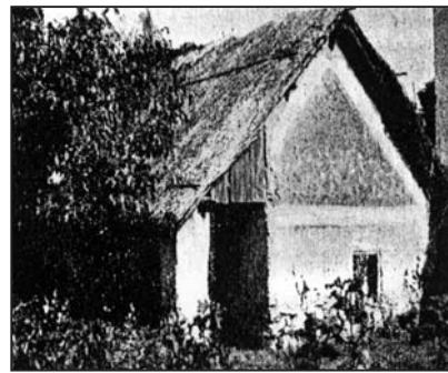
Ezt tartották az 1931-ben történt emlékmű leleplezéséig Batsányi János költő szülőházának