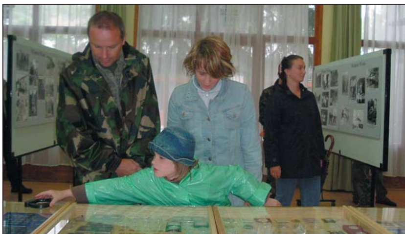
A régi pénzekkel és érmekkel teli tárlók sok érdeklődőt vonzottak

Id. Karai Sándor a II. világháborúban haditudósítóként járta a frontokat. Az itt kiállított, döbbenetes erejű képei a reménytelen küzdelmet, a szenvedést és a tragédiát mutatják be.