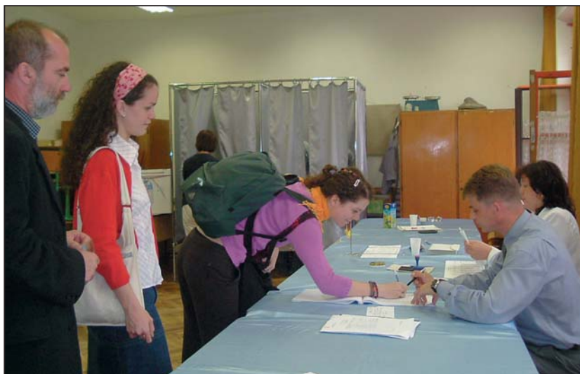
Szavazók a Bárdos Lajos Általános Iskola egyik szavazóhelyiségében

A győztes FIDESZ-re 56,31 százalék szavazott