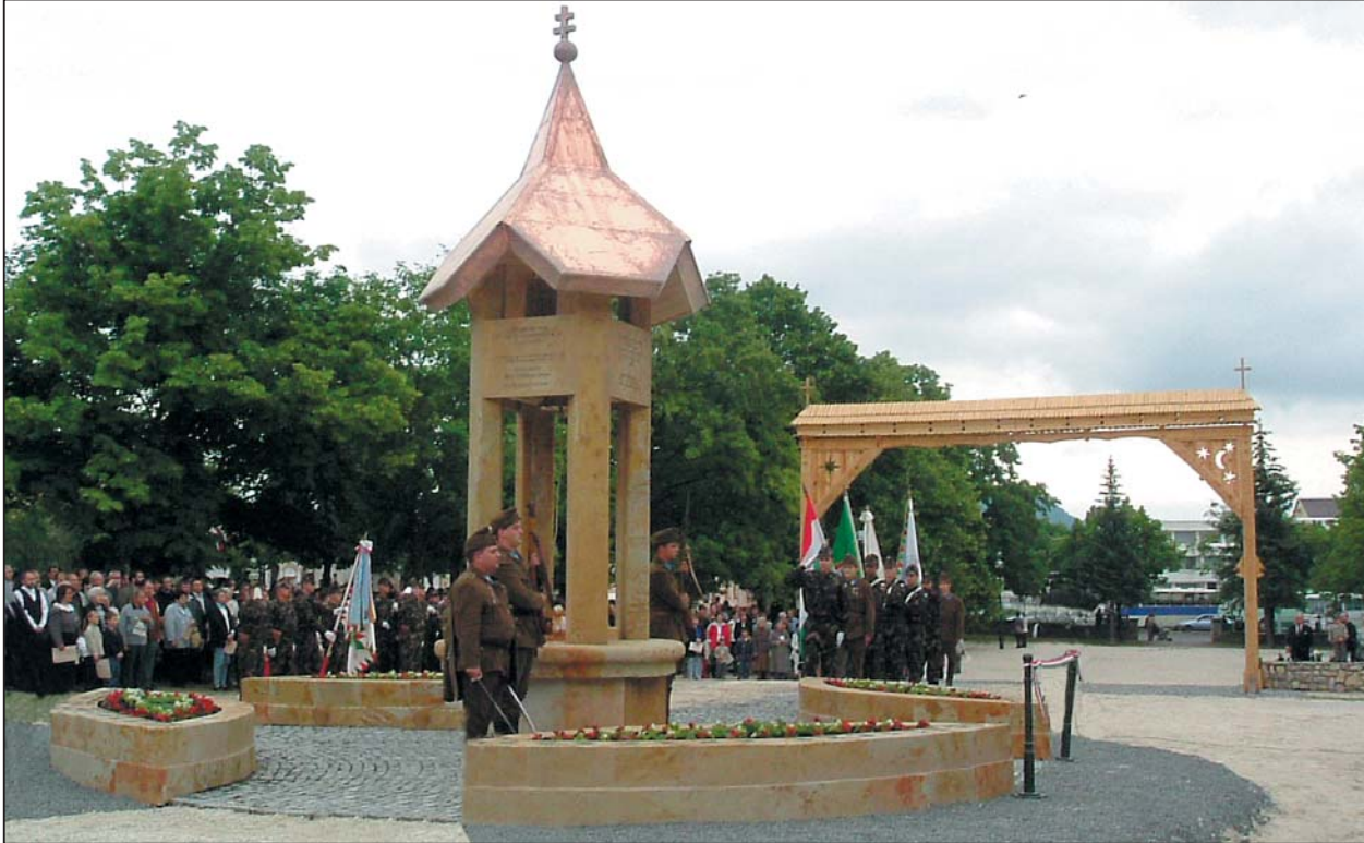
A katonai tiszteletadás pompájával felavatott emlékhely a 64 magyar királyi vármegye földjét is őrzi

/Összeállításunk a 4. oldalon Soha többé ne legyenek Trianonok! címmel./