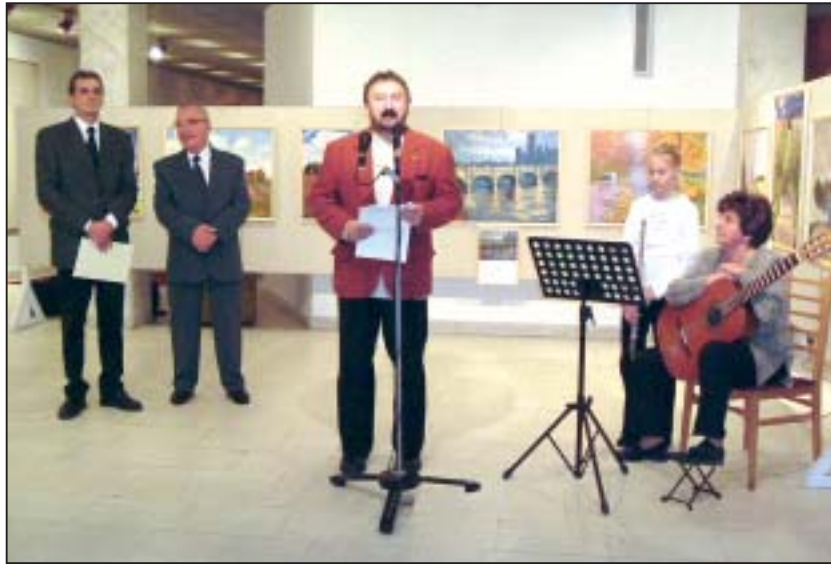
Az impresszionista művek világa mind azt üzeni, hogy elmúlhatnak a háborús évek, elszaladhatnak sorsunk legkomiszabb percei, de a pillanat örök

Végezetül Németh István Péter arra kérte a festőművészt, hogy - akár Monet stílusában is - örökítse meg a kicsinyke tapolcai Malomtónál látható reflexeket a vízen, a tükröződő napernyők hangulatát, az égen és a víztükren izzó dupla Napot, a békalencse mesésépen szőtt zöldjét.