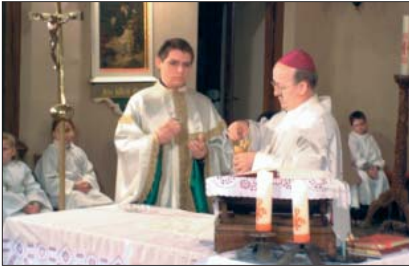
Az érsek szentbeszédében az advent közeledtéről, a béke és a szeretet nélkülözhetetlenségéről beszélt

Az ünnepélyes búcsúztatón részt vettek a hadkiegészítő parancsnokságok vezetői, a kiképző központ civil kapcsolatainak képviselői, valamint a szakképzést folytató katonai szervezetek tagjai is. NHE