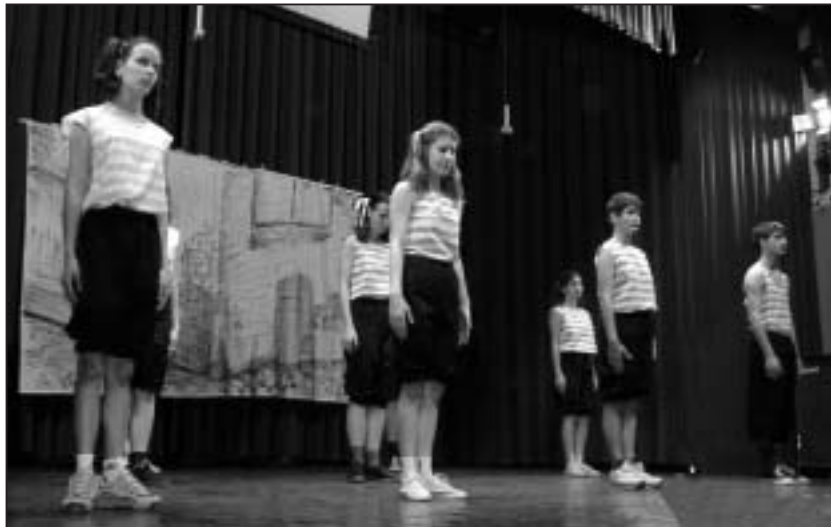
Régi idők tornája a tapolcaiak előadásában