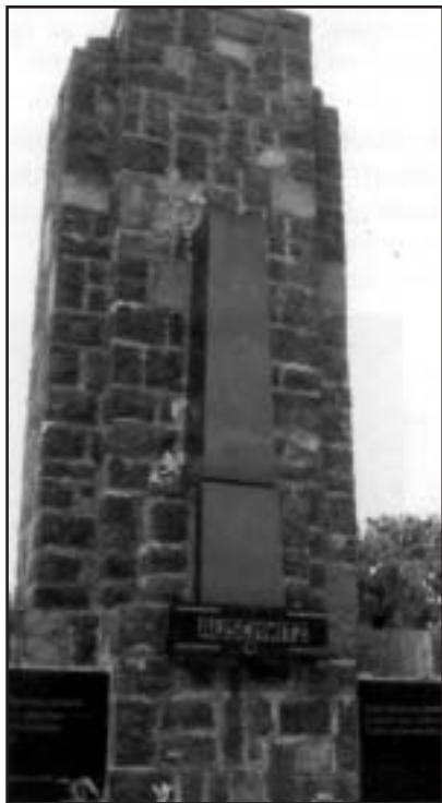
Mementó a tapolcai izraelita temetőben

A rabbi zengő hangja betölti a termet. Ne a holtat sirassátok! - mondja először héberül, majd magyarul. Megemlékező beszédének visszatérő mottója ez a mondat. Míg beszél, megértem, mi a jelentősége, hogy aki meghalt a gázkamrában, vagy a légerek bűzös oduiban, már megpihent, de a túlélő egész életére sebet kapott. Ott cipeli magában, testében-lelkében egyaránt a borzalmakat, nem adatik meg neki a teljes béke, még kevésbé a felejtés. Tehát őket kell siratni, a túlélőket. A kántor héberül énekel. A szöveget nem értem, de a fájdal-