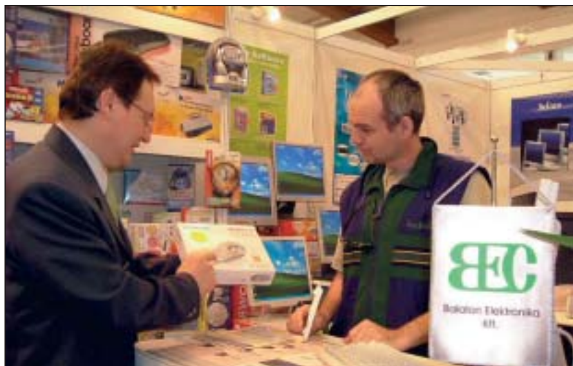
A tavalyi vásárdíjas Balaton Elektronika Kft. a számítástechnika új termékeivel jelentkezett a kiállításon