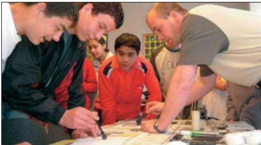
Amikor a bűnjel "beszélni kezd"

Április 23-án a város általános- és középiskolásainak nyílt napot tartott a Tapolcai Rendőrkapitányság. A technikai bemutatók, a kutyakiképzés is nagy sikert aratott.