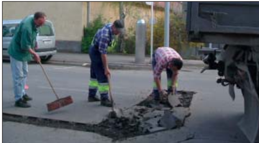
Hamarosan "zökkenőmentesek" lesznek a tapolcai utak

Az elkövetkezendő időben az önkormányzat külön gondot fordít arra, hogy a helyreállítást csak útépítéssel kapcsolatos jogosultsággal rendelkező kivitelezővel végeztessék el az illetékesek. A garanciális feltételek megszabása is javíthat majd az úttálopotokon.