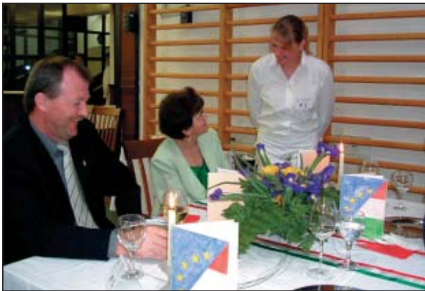
A német felszolgáló kedves mosollyal hidalta át a nyelvi nehézségeket

A közelgő Eu-csatlakozás és az olimpia jegyében hívta nemzetközi gasztronómia randevúra Halle, Stadthagen és Wrocław szakács- és felszolgáló tanulóit a Széchenyi István Szakképző Iskola április 19-22-ig.