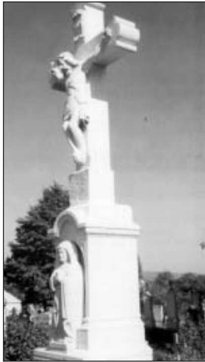
A díszeli temető Mindenki keresztje

A Stabat Mater egyik megzenésítője Pergolesi /1710-1736/. Ezen az estén az Ő művét is hallhattuk. A műsor első felében a vokális zene mutatta meg értékeit. Azért, mert a kifinomult előadás, a tiszta szólamvezetés, a dinamikus átmenetek egyensúlya és főleg az emberi hang szépsége meggyőzően szólalt meg. A Pergolesi-mű előadói apparátusa már nagyobb volt. Itt tetten érhetjük Frescobaldi utasítását. Énekeltek a vonósok is. A két szólista tel-